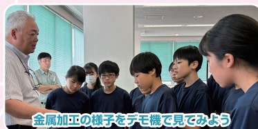
金属加工の様子をデモ機で見よう