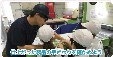
仕上がった製品の手ざわりを確かめよう