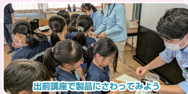
出前講座で製品にさわってみよう