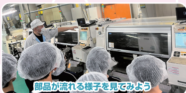
部品が流れる様子を見よう