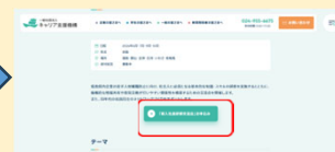
新入社員研修交流会開催のお知らせ

➡ 申込フォームよりお申込みください。URL https://career-shienkikou.com/information/6825/