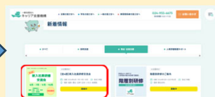
新着情報(育成・定着支援)