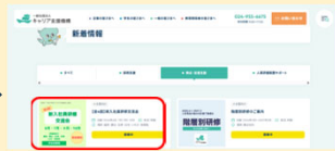
新着情報(育成・定着支援)