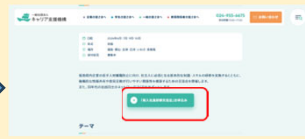
新入社員研修交流会開催のお知らせ