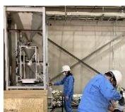
2024 年入社 製作 1 係