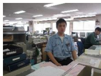
2017 年入社 果実1部