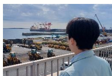
2019 年入社 代理店課