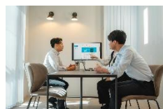
2017年入社 税理士補佐