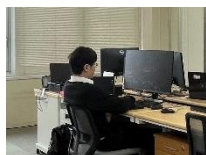
2024 年入社 第 1 システム開発