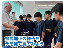
金属加工の様子を デモ機で見よう