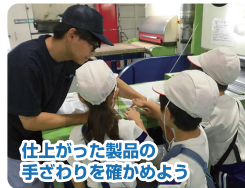
仕上がった製品の 手ざわりを確かめよう