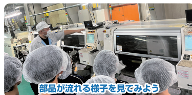
部品が流れる様子を見よう