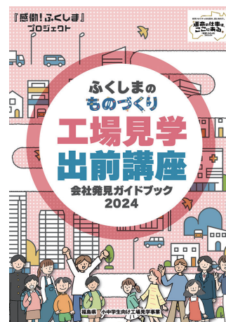
「ふくしまのものづくり工場見学・出前講座会社発見ガイドブック2024」

FAX▶024-955-6676 E-mail▶monodukuri@career-shienkikou.com