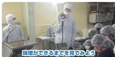
味噌ができるまでを見よう