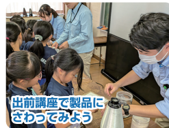
出前講座で製品に ざわつてみよう