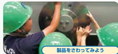
製品をさわってみよう