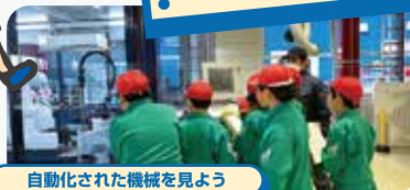
自動化された機械を見よう