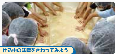
仕込中の味噌をさわってみよう