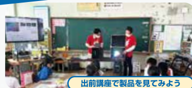
出前講座で製品を見てみよう