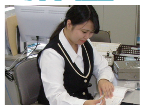
E.M 2018年入社 総務部