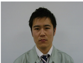
R.K 2014 年入社 建築部