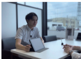
H.S 2021年入社 営業