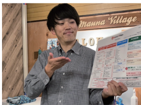
石川 2021年入社 ゴルフコース