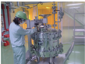
H.T 2016年入社 製造課