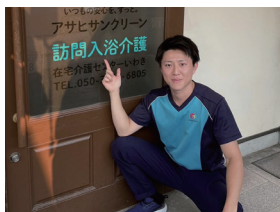
青天眼(いわき事業所) 2022年入社 新卒介護職員