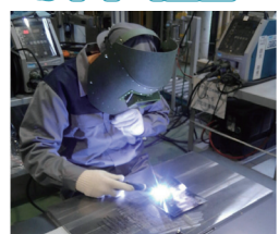
S.H 2023年入社 いわき工場