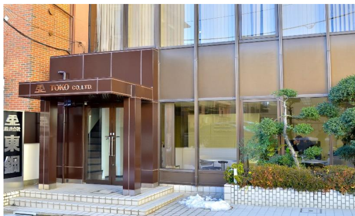
▲ 東京都文京区 本社前