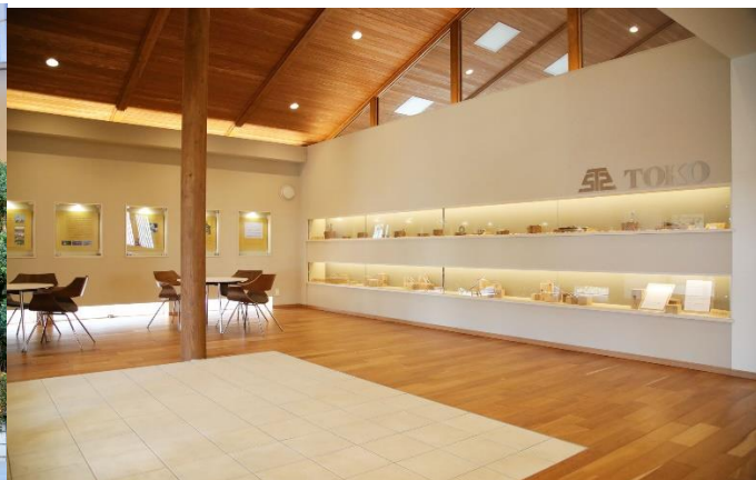
▲ 福島工場 エントランス