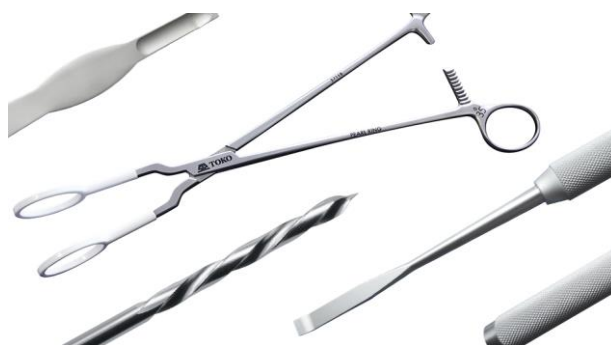
▲ オメガドリルやパールリングなど

また、医療分野では参入から10年程でオメガドリルやパールリングなどの東鋼ブランドの製品も生み出しています。